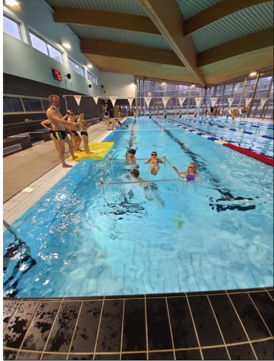
Un grand MERCI aux parents accompagnateurs !